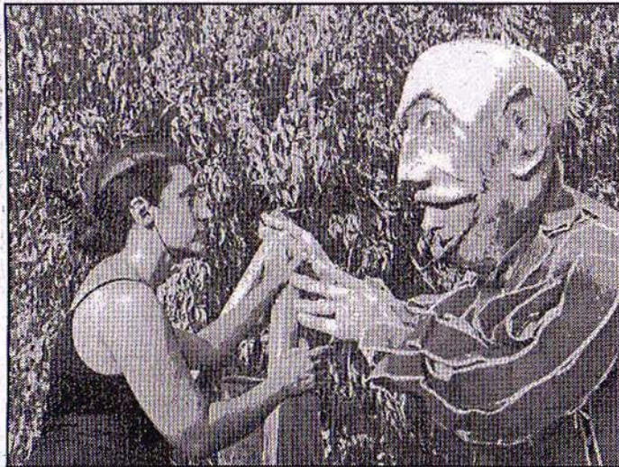
Pitchouko le nain géant sera dans les rues de Pelissanne dimanche pour raconter des histoires aux petits et aux grands.

► Pitchouko le nain géant dimanche 21 octobre à 14 h 30 et 16 h 30, départ salle Carnot. Durée 1 heure.